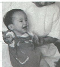
※写真は、ご本人が幼少時のものです。

ことはないと思っています。力強く生きることで苦難を乗り切るしかないのです。このサリドマイドが、現在、再び認可され使われています。多発性骨髄腫という血液のがんやハンセン病の症状に効果があることが分かったためです。薬そのものが悪いのではない——二度と同じような被害を起こさないために、この薬の危険性をよく知って、慎重に使用してほしいと思います。