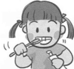
①歯を磨いて、汚れをよく落とす。

市内の小学校では週1回、フッ化ナトリウム濃度900ppm (0.09%)の洗口液10mlを使用して実施しています。保育園や幼稚園では、毎日1回、年齢ごとに異なった濃度で実施しています。洗口液とは、フッ化ナトリウムを水道水に溶かしたものです。