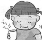
②洗口液を口に含んでから、うつむいてフックうがいを約1分間行う。