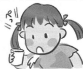
③洗口液を吐き出す。洗口後、30分間は飲食を避ける。